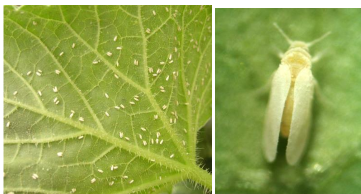
Εικόνα 1. Ο αλευρώδης του καπνού Bemisia tabaci , φορέας του ιού του καρουλιάσματος των φύλλων της τομάτας Νέο Δελχί (ToLCNDV).

Ο ιός ToLCNDV μεταδίδεται αποκλειστικά με έντομα του είδους Bemisia tabaci (Hemiptera: Aleyrodidae), με έμμονο τρόπο. Η κοινή ονομασία του εντομολογικού εχθρού είναι αλευρώδης του καπνού (Εικόνα 1). Το είδος είναι ενδημικό της περιοχής μας και σημαντικός εχθρός πολλών καλλιεργειών, ειδικότερα της τομάτας. Ο B. tabaci έχει την ικανότητα να μεταδίδει πλειάδα ιολογικών ασθενειών των φυτών. Σε μεγάλες αποστάσεις ο ιός ToLCNDV μπορεί να μεταφερθεί με μολυσμένα φυτά ξενιστές (εμπορική διακίνηση φυτών).