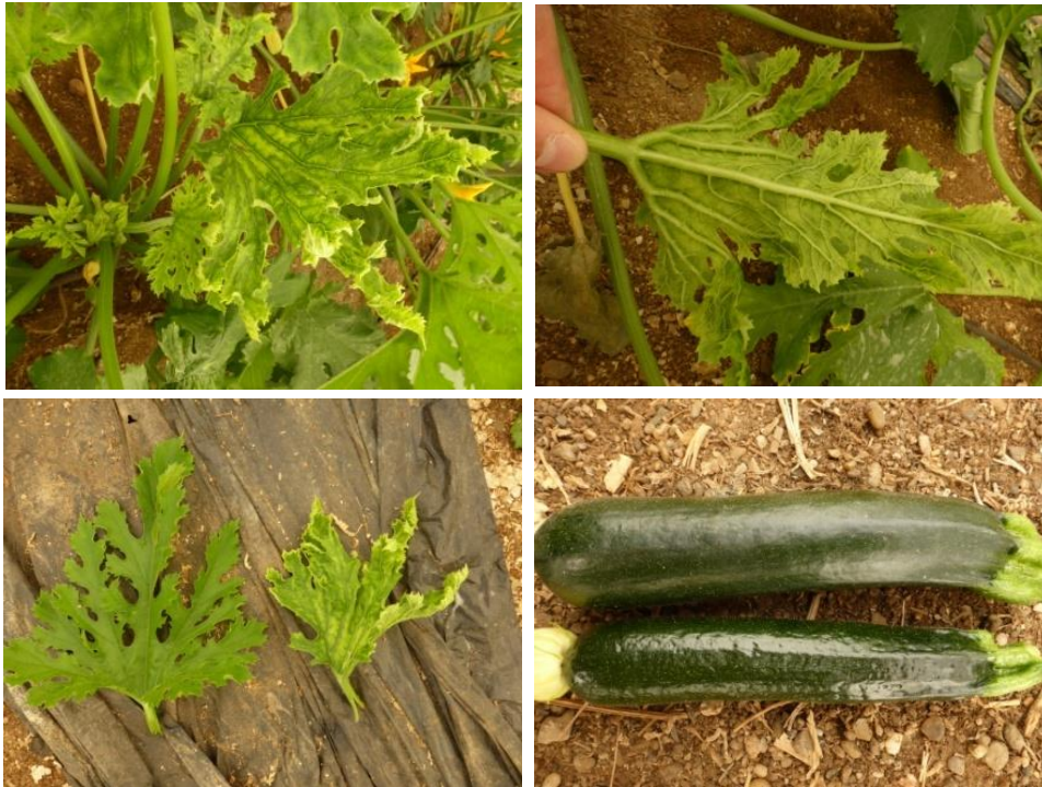
Εικόνα 2. Συμπτώματα σε φύλλα και καρπούς κολοκυθιού από τον ιό του καρουλιάσματος των φύλλων της τομάτας Νέο Δελχί ( Tomato leaf curl New Delhi virus, ToLCNDV ) από την περιοχή της Ισπανίας.