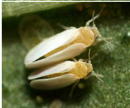
Εικόνα 3. Αλευρώδης του καπνού. Νύμφες 4ου σταδίου: χωρίς κηρώδεις αποφύσεις. Ενήλικα: πτερυγες με κάθετη τοποθέτηση κατά την ηρεμία.