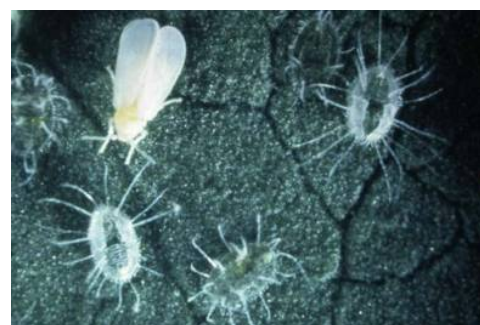
Εικόνα 2. Αλευρώδης θερμοκηπίων. Οι πτερυγες τού ενηλίκου έχουν οριζόντια τοποθέτηση κατά την ηρεμία και οι νύμφες 4ου σταδίου φέρουν μακριές κηρώδεις αποφύσεις.